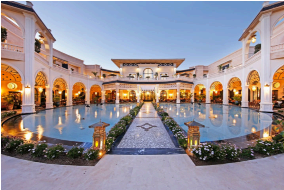
Palais Ronsard, Marrakech, Maroc

Les membres de Relais & Châteaux ont le profond désir de protéger, faire vivre et valoriser la richesse et la diversité de la cuisine et des cultures hospitalières de la planète. Ils ont porté cette ambition, comme celle de la préservation des patrimoines locaux et de l'environnement, au travers d'un Manifeste présenté en novembre 2014 à l'Unesco.